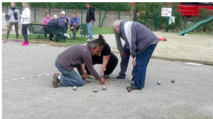
Sérieux et appliqué