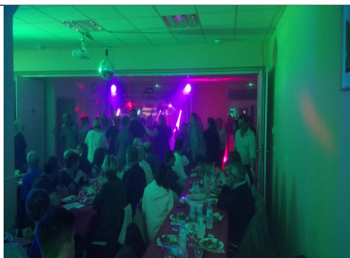
Beaucoup d'ambiance lors de la soirée couscous qui fut une très belle réussite