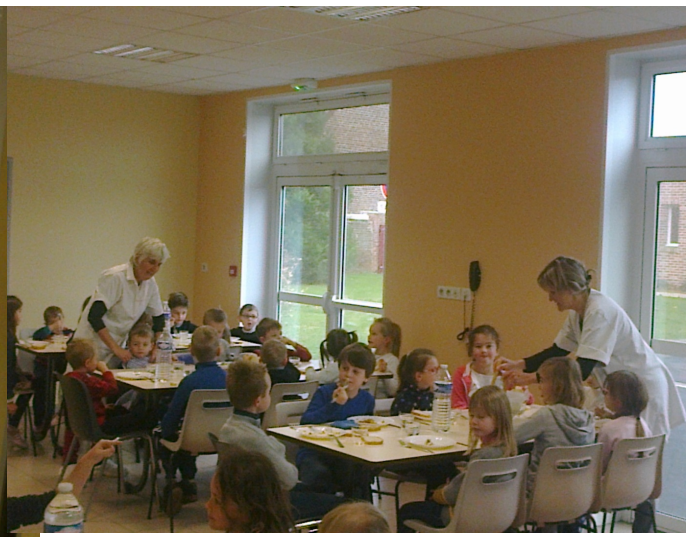
Photographies du SIVU RPI Boisieux Au Mont, Boisieux Saint Marc, Hamelincourt, Moyenneville